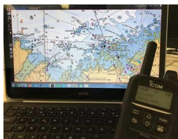
Portatif LTE en situation devant le « PC cartographie » du départ

L'outil, d'une simplicité et d'une fiabilité irréprochables, nous a donc permis d'échanger facilement et instantanément des informations clés entre les différentes entités de l'organisation : PC Course, Directeur de Course, Coordinateur Nautique, leaders sécurité et enfin les moyens de l'État. »