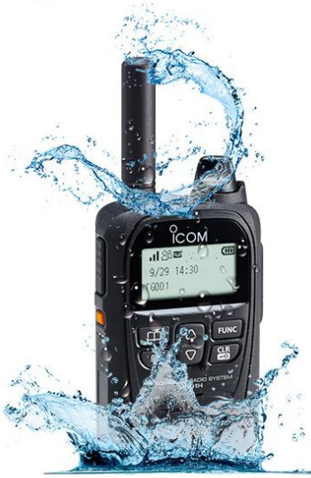
Portatif radio LTE ICOM

ICOM France a déployé près de 90 radios fixes et portables pour une organisation millimétrée et une sécurité maximale. Pour la première fois, l'organisation a pu tester en exclusivité la nouvelle solution de communication radio LTE ICOM !